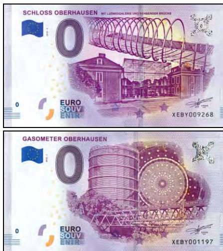
Voorbeelden van 0-Euro biljetten uit de collectie van Optische Fenomenen. Een holografische folie en andere kenmerken zorgen voor de echtheid. In het Mozart-museum in Salzburg kochten wij onze eerste 0-Euro biljetten via een automaat.