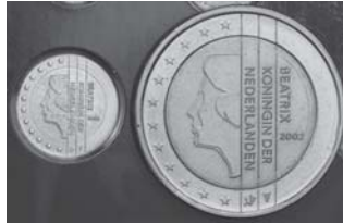
2-Euro-Prägung aus dem Mini-KMS Niederlande 2002. Der Durchmesser des kleinen „Zweiers“ beträgt 13,15 mm. Im Bild der direkte Vergleich mit einer 2-Euro-Umlaufmünze.

Die königlich-niederländische-Münze verkaufte bereits, als der Gulden noch Zahlungsmittel in den Niederlanden war, sogenannte „Mini-Muntsets“ an Sammler. Dabei handelt es sich um detailgetreue Nachprägungen der Münzwerte in Gulden in sehr kleinem Format. Gleiches erfolgte auch im Jahr 2002 mit den niederländischen Euro-Münzen. Der Verkauf des Satzes musste jedoch auf Druck der EZB eingestellt werden. Es handelt sich hierbei nicht um Münzen!