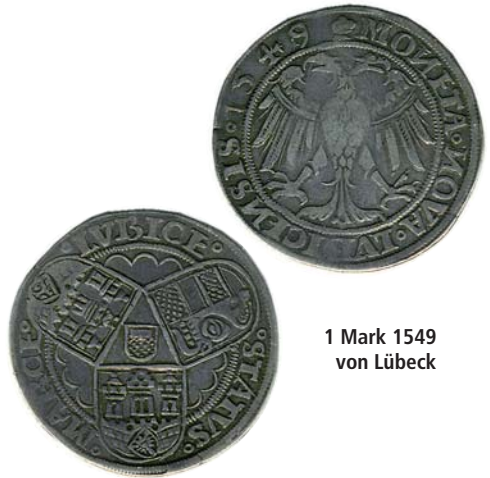
1 Mark 1549 von Lübeck

Der Shilling ist als „dritte Währungseinheit“ Großbritanniens 1971 weggefallen. Seinen Namen hat er übrigens vom lateinischen „Solidus“. Als Name hatte die von den Römern eingeführte Münze in England bis zu jenem Jahr überlebt. Im Mittelalter wurde auch bei uns der Solidus (Schilling) in karolingischer Zeit zur Rechnungsmünze von 12 Pfennig oder 1/20 Pfund. Eine „Rechnungsmünze“ war kein Geldstück, sondern nur eine Rechengröße. Erst als ab dem 13. Jahrhundert Groschen zu 12 Pfennig geprägt wurden, gab es den Solidus/Schilling auch als