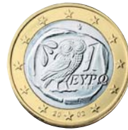
1-Euro-Münze Griechenlands von 2002 mit der Darstellung einer Tetradrachme von Athen