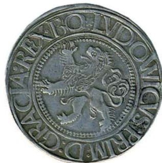
Joachimsthaler der Grafen Schlick um 1520