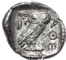
Tetradrachme aus Athen, um 449 v. Chr.