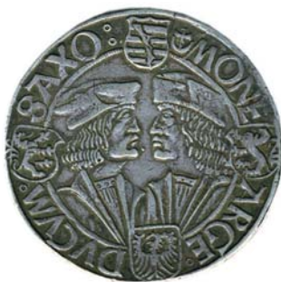
Sächsischer Klappmüntzentaler aus der Münzstätte Leipzig aus der Zeit von 1507 bis 1525. Die Bezeichnung „Klappmüntzentaler“ ist auf die Kopfbedeckung der beiden Herzöge zurückzuführen. Der mit dem Kurschwert dargestellte Kurfürst trägt keine Klappmütze, sondern den Kurhut.

bus“) seit der Mitte des 14. Jahrhunderts eine wichtige Groschenmünze. Die Groschen beeinflussten das ganze mitteleuropäische Münzwesen, sodass sie, eingeteilt in 12 Pfennige, zu einer der wichtigsten Handelsmünzen wurden.