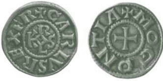
Pfennig (Denar) Karls des Großen (768 – 814) aus der Münzstätte Mainz