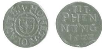
3-Pfennig-Stück 1622 der Stadt Wismar mit der Schreibweise PHENNING

Schweden, Dänemark und Norwegen. In Finnland war die Mark Zahlungsmittel von 1864 bis zur Euro-Einführung, die Polen hatten von 1916 bis 1924 eine „Mark“, ebenso wie die Esten von 1922 bis 1926. Seit 2002 gibt es die Mark als Währungseinheit nur noch in Bosnien-Herzegowina, wo sie 1998 als „Konvertibilna Marka“ zu 100 Feninga eingeführt wurde.