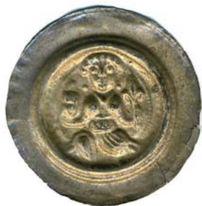
Brakteat der Markgrafschaft Meißen, Dietrich der Bedrängte (1197 – 1221), Münzstätte Leipzig

An dieser Stelle soll nur kurz auf eine besondere Münzart dieser Geschichtsperiode eingegangen werden, und zwar auf die „Brakteaten“. Diese Münzen haben heute ihren Namen von lat. „bractea = dünnes Blech“. Sie bestehen nur aus rasierklingendünnem Silberblech, das einseitig geprägt wurde, was sie sehr zerbrechlich macht. Diese Münzen entstanden im 12. bis 14. Jahrhundert.