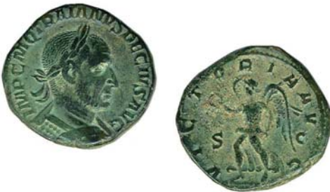
Sesterz des römischen Kaisers Traianus Decius (249 – 251 n. Chr.) mit der Darstellung der Siegesgöttin Victoria auf der Rückseite

Battenberg Gietl Verlag GmbH, 4. Auflage 2022, Format 17 x 24 cm, ca. 550 Seiten, Preis: 39,90 Euro, ISBN 978-3-86646-210-6