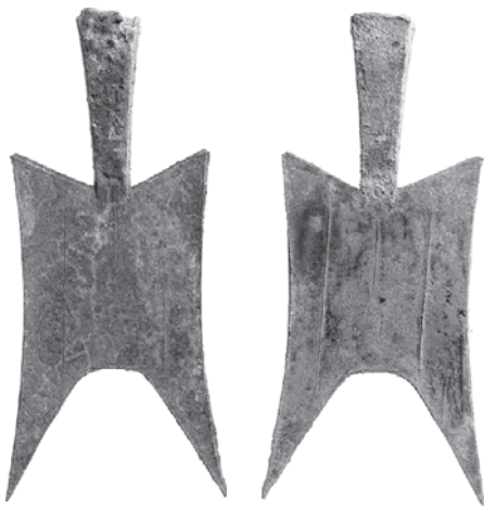
China, Chou-Dynastie, Staat Jin, Hohlstiel-Spatenmünze, 602 – 585 v. Chr.

in China schon seit dem 7. Jahrhundert v. Chr. Man bezeichnet sie auch als „vormünzliches“ Geld. Sie waren übrigens noch lange Zeit neben Münzen im Umlauf. Metalle sind im Gegensatz zu Vieh nicht sterblich und können nicht verderben, wie Wein oder Getreide, sie verändern sich über Jahrhunderte meist nicht. Als Universaltauschmittel setzten sich schließlich Metalle durch, besonders die edlen, also Gold und Silber.