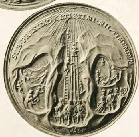
Anhalt-Bernburg-Harzgerode. Wilhelm (1670–1709). Geharnischtes Brustbild des Fürsten nach rechts, Umschrift: GVILIELMVS D G PRINC – ANHALT D SA ET W C A D B ET S. Rückseite: Querschnitt des Bergwerks. Im Hauptschacht ist unten die fürstliche Familie angeordnet worden.