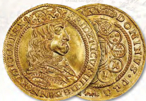
DENMARK. 1/2 Portugaloser (5 Ducats), 1653-HK. Copenhagen Mint. Frederik III. NGC MS-62.

Kosciuszko Foundation House • 15 East 65th Street, New York, NY 10065