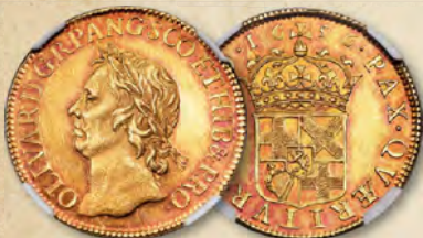
Großbritannien: Oliver Cromwell Gold-Proof-Muster, 20 Schilling, 1656 PR63 PCGS Ex. Cara; Chalaza; Selig Erzielter Preis: 126.000 US-Dollar