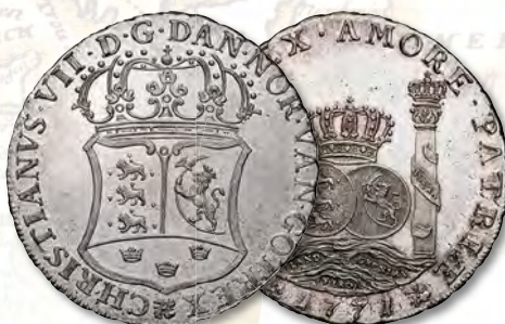
DENMARK. Piaster, 1771 (struck in 1774). Copenhagen Mint. Christian VII. NGC MS-62.