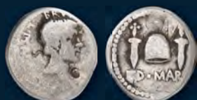
Auktion 438, Los 518 M. Iunius Brutus. Denar, 42 v. Chr., Lagermünzstätte in Kleinasien oder Nordgriechenland. Von großer Seltenheit. EID MAR Darstellung gut lesbar auf dem Revers. Prüfpunzen auf dem Avers, schön/schön-sehr schön. Schätzung: 50.000 Euro