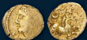
Auktion 438, Los 29 Gallia. Arverni. Vercingetorix, 52 v. Chr. Stater. Von großer Seltenheit. Gutes sehr schön. Schätzung: 40.000 Euro