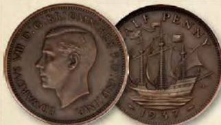
Großbritannien: Edward VIII. Bronze, matt, Probedruck, 1/2 Penny, 1937 PR64 Braun, NGC Ex. Cara; Giordano; Globus Erzielter Preis: 180.000 $