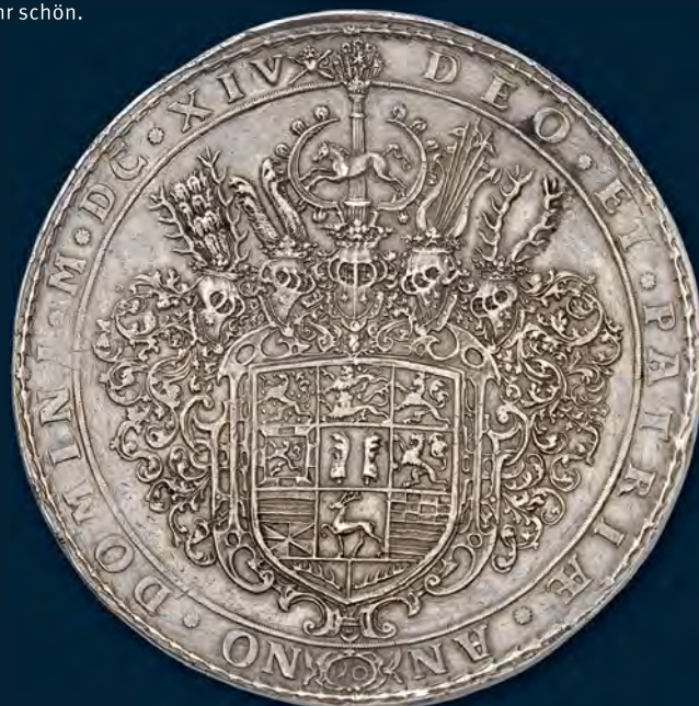
Auktion 441, Los 4111 Braunschweig-Wolfenbüttel. Friedrich Ulrich, 1613-1634. Löser zu 10 Reichstalern 1614, Goslar oder Zellerfeld. Von größter Seltenheit. Feine Patina, sehr schön. Schätzung: 100.000 Euro