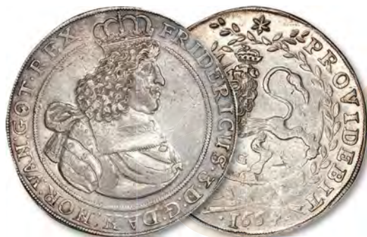
NORWAY. 3 Speciedaler, 1664. Christiania Mint. Frederik III. NGC AU Details.