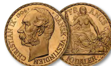
DENMARK. Danish West Indies. 50 Francs / 10 Daler, 1904. Copenhagen Mint. Christian IX. NGC MS-68.