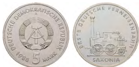
DDR. 5 Mark 1988 mit der Darstellung der ersten deutschen Lokomotive „Saxonia“.

Die erste deutsche Lokomotive, die „Saxonia“, wurde auch auf einem 5-Mark-Stück der DDR abgebildet.