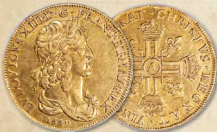
*Frankreich: Louis XIII Gold 10 Louis d'Or 1640-A AU Details NGC Ex. Manteyer Erzielter Preis: 264.000 $