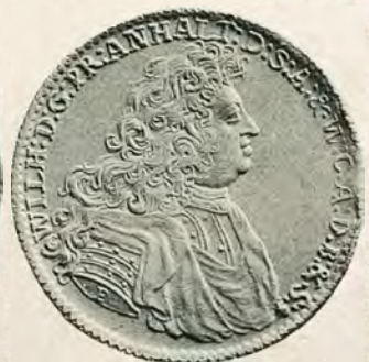
Anhalt-Bernburg-Harzgerode. Wilhelm (1670–1709). Ausbeutetaler 1694. Geharnischtes Brustbild mit Überwurf nach rechts, Umschrift: WILH. D G PR ANHALT D S A & W C A D B & S. Rückseite: Im Feld die fünfzeilige Inschrift: NACH / ALTEN / REICHS=SCHROT / UND KORN / 1694, Umschrift: VON NEUEN ANHALTISCHEN BERGWERCK