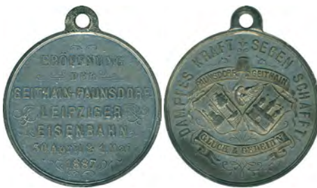
Zinnmedaille 1887 auf die Eröffnung der Eisenbahnlinie Geithain-Paunsdorf-Leipzig

Zu den Eisenbahnstrecken rund um Leipzig gehörte auch die Eisenbahnverbindung Geithain-Paunsdorf-Leipzig als Teil der Strecke nach Chemnitz.