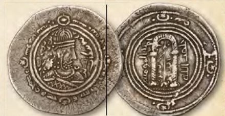
Islamische Dynastien: Kalifat der Umayyaden. Abd al-Malik (65–86 n. H. / 685–705 n. Chr.). AR-Drachme. VF Erzielter Preis: 84.000 $

Bei Anfragen: Heritage Auctions Deutschland GmbH | HA.com/Munich | +49 (0) 89/37 03 7617 | Munich@HA.com