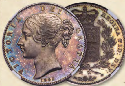
Großbritannien: Victoria Proof Crown 1845 PR64 NGC Erzielter Preis: 78.000 $