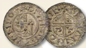
SWEDEN. Penny, ND (995-1022). Sigtuna Mint. Olof Skötkonung. NGC MS-61.