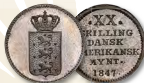
DENMARK. Danish West Indies. 20 Skilling, 1847. Copenhagen Mint. Christian VIII. NGC MS-69.