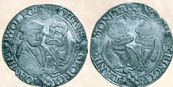
Anhalt gemeinsam. Wolfgang, Johann IV., Georg III. und Joachim. Guldengroschen 1539, Münzstätte Harzgerode. 1. Anhalter Talerprägung aus dem Silber der Grube Birnbaum.

Die Gruben um Harzgerode der Fürsten von Anhalt im Straßberg-Neudorfer-Gangzug (Gruben von Birnbaum) förderten bereits im 16. Jahrhundert eine nennenswerte Menge an Silbererz, die auch die Ausprägung von Ausbeutetalern ermöglichte. Überliefert ist ein Besuch der Gruben „Birnbaum“ und „Heilige Drei Könige“ durch die Fürsten Joachim und Johann von Anhalt im Jahr 1539. Eine kontinuierliche Förderung war aber wegen der notwendigen Zubußen nicht möglich.