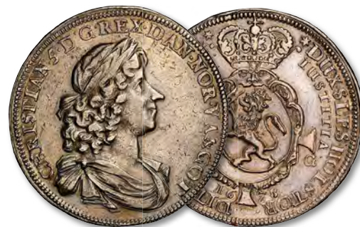
NORWAY. 3 Speciedaler, 1678. Christiania Mint. Christian V. NGC AU Details.

Learn more about the L.E. Bruun Collection at StacksBowers.com .