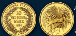
Auktion 439, Los 2887 Deutsch-Neu-Guinea. 10 Neu-Guinea Mark 1895 A. Nur 2.000 Exemplare geprägt. Prachtexemplar. Polierte Platte. Schätzung: 50.000 Euro