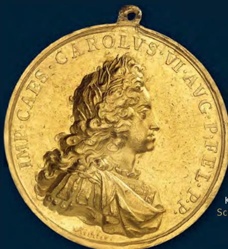
Auktion 439, Los 2287 Römisch-Deutsches Reich. Karl VI., 1711-1740. Tragbare Goldmedaille zu 40 Dukaten 1711. Von allergrößter Seltenheit, vermutlich Unikum. Kl. Randfehler und Kratzer, sehr schön-vorzüglich. Schätzung: 40.000 Euro