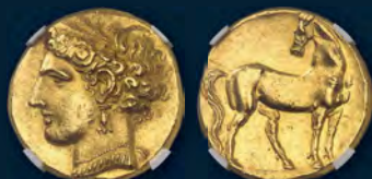
Auktion 438, Los 449 Zeugitania. Karthago. Trihemistater, um 260 v. Chr. Sehr selten. Hübsche Goldpatina, winz. Kratzer, vorzüglich. Schätzung: 40.000 Euro