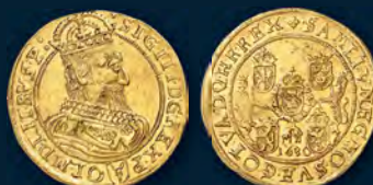
Auktion 439, Los 2176 Königreich Polen. Sigismund III., 1587-1632. Dukat 1630, Bromberg. Von allergrößter Seltenheit. Prachtex- emplar. Vorzüglich-Stempelglanz. Schätzung: 75.000 Euro