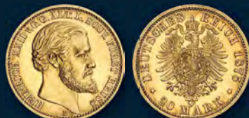
Auktion 439, Los 2821 Reuss Älterer Linie. Heinrich XXII., 1859-1902 20 Mark 1875. Sehr selten, besonders in dieser Erhaltung. Vorzüglich-Stempelglanz. Schätzung: 35.000 Euro