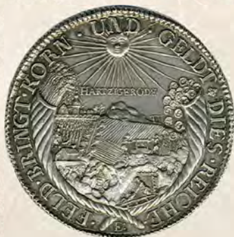
Anhalt-Bernburg-Harzgerode. Wilhelm (1670–1709). Probe-Ausbeutetaler 1693 mit schräg geriffeltem Rand. Inschrift in 16 Zeilen:

Die Verwüstungen des Dreißigjährigen Krieges brachten den Bergbau im anhaltischen Teil des Harzes zum Erliegen. Erst am Ende des 17. Jahrhunderts konnte er wieder aufgenommen werden. Neben dem nachfolgend gezeigten Probe-Ausbeutetaler wurden motivgleiche Medaillen und eine große Medaille 1694 auf den Besuch der fürstlichen Familie in der Grube „Elisabeth Albertine“ im Birnbaumer Revier ausgebracht.