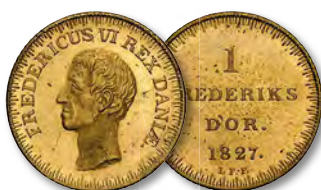
DENMARK. Frederik d'or, 1827. Altona Mint. Frederik VI. NGC MS-65.