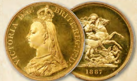
Großbritannien: Victoria Gold Proof 5 Pounds 1887, PR66+ Deep Cameo PCGS Erzielter Preis: 168.000 $