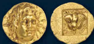
Auktion 438, Los 320 Caria. Rhodos. Stater, 125/88 v. Chr. Von allergrößter Seltenheit. Hübsche Goldtönung, kl. Auflagen, sehr schön. Schätzung: 50.000 Euro