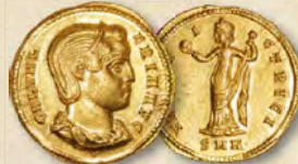
Galeria Valeria (293–311 n. Chr.). AV aureus NGC Choice AU 4/5 – 3/5 Erzielter Preis: 38.400 $