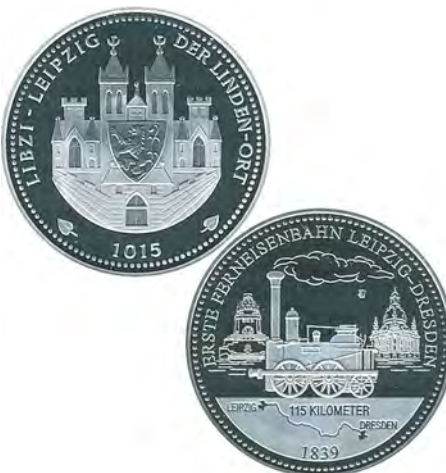
Silbermedaille mit dem Motiv der „Saxonia“ auf einer Medaille aus der Serie „1000 Jahre Leipzig“

Die „Saxonia“ ist auch das Motiv auf einer Silbermedaille aus der von MDM initiierten Medaillenserie „1000 Jahre Leipzig“