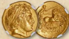
KÖNIGREICH MAZEDONIEN. Philipp II. (359–336 v. Chr.). AV-Stater NGC MS 5/5 – 4/5, Fine Style Erzielter Preis: 37.200 $

Einlieferungen für unsere CSNS-Auktion werden ab sofort entgegengenommen. Einsendeschluss: 27. Februar 2026