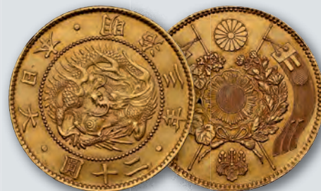
Japan: Meiji gold 20 Yen Year 3 (1870) MS62 NGC