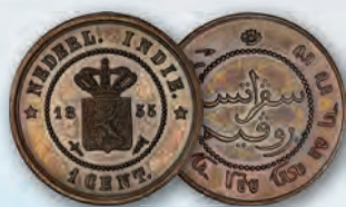
Netherlands East Indies: Dutch Colony Willem III Proof Specimen Pattern Cent 1855 SP64 Brown PCGS