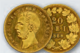
Romania: Carol I gold Proof Specimen Pattern 20 Lei 1868 SP63 Deep Cameo PCGS From a Special Collection of Romanian Coins

INQUIRIES: Heritage Auctions Europe Cooperatief U.A.