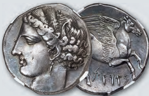
SICILY. Siculo-Punic. Ca. 264-260 BC AR 5-shekels or decadrachm NGC XF 5/5 - 3/5, Fine Style