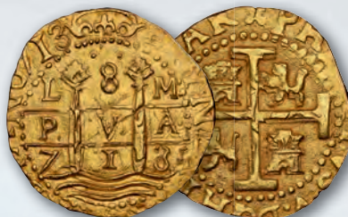
Peru: Philip V gold Cob 8 Escudos 1713 L-M MS62 NGC