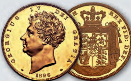
Great Britain: George IV gold Proof 5 Pounds 1826 PR63+ Deep Cameo PCGS