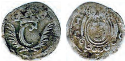
Abbildung in doppelter Größe, der Originaldurchmesser beträgt 13 mm

Redaktion: Ja, es handelt sich um ein 3-Heller-Stück (¼ Albus) von Hessen-Kassel. Das C symbolisiert den Landgraf Carl von Hessen-Kassel, der von 1670 bis 1730 regierte.