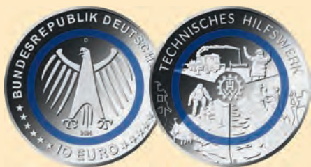
10-Euro-Stück 2025 „Technisches Hilfswerk“