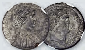
Cleopatra VII and Marc Antony, rulers of the East (37-30 BC) AR tetradrachm NGC Choice AU 4/5 - 4/5