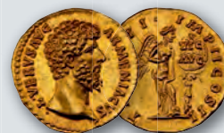
Lucius Verus (AD 161-169) AV aureus NGC Gem MS 5/5 - 5/5, Fine Style