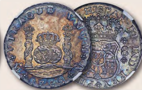
Mexiko: Philipp V. „Gefräst“ 8 Reales 1732 Mo-F MS61 NGC Aus der Grundy-Sammlung