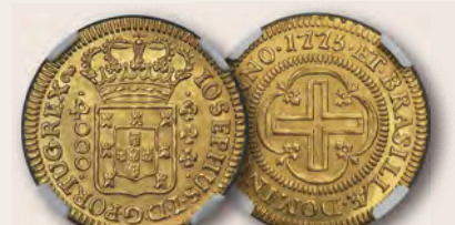
Brasilien: José I., Goldmünze „Große Krone“ 4000 Reis, 1775-(L) MS63 NGC Aus der Sammlung Vila Rica, Teil II

Bei Anfragen: Heritage Auctions Deutschland GmbH HA.com/Munich | +49 (0) 89/37 03 7617 | Munich@HA.com