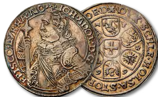
GERMANY. Schleswig-Holstein. Taler, 1599. Steinbeck Mint. Gustav II Adolf. NGC EF Details.