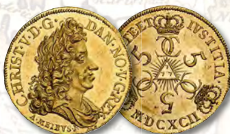
DENMARK. 2 Ducat, 1692. Copenhagen Mint. Christian V. NGC MS-62.