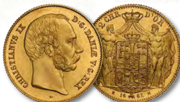
DENMARK. 2 Christian d'Or, 1867. Copenhagen Mint. Christian IX. NGC MS-67.