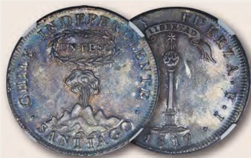
Chile: Republik „Vulkan“-Peso 1817 SANTIAGO-FJ MS63 NGC Aus der Grundy-Sammlung