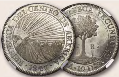
Guatemala: Republik Zentralamerika 8 Reales 1847/6 NG-A MS65+ NGC Aus der Grundy-Sammlung