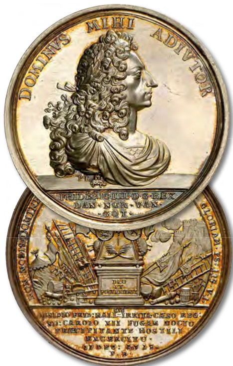
DENMARK. Liberation of Frederikshald Fortress Restrike Silver Medal, 1718. Frederik IV. NGC MS-67.