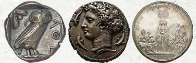
Athen, Tetradrachme; Syrakus, Dekadrachme; Medaille 1785 von Caspar Joseph Schwendimann auf die Vereinigung der Kurpfalz mit Bayern

Die Online-Stellung ist ein erstes Ergebnis der Erforschung, Inventarisierung, Restaurierung und Digitalisierung von insgesamt rund 6000 Münzen, Medaillen und Plaketten aus über 2500 Jahren Bildgeschichte aus dem bisher weitestgehend unveröffentlichten Bestand der Skulpturenabteilung der Hamburger Kunsthalle. Das dazu seit 2023 laufende Forschungsprojekt Von der zweiten zur dritten Dimension wird durch die Dorit & Alexander Otto Stiftung ermöglicht, die damit wiederholt als maßgebliche Förderin der Kunsthalle wirkt.