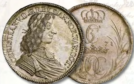
DENMARK. Danish East India Company. Speciedaler, 1671. Copenhagen Mint. Christian V. NGC MS-60 – Rare variation w. edge lettering.

A CORPUS OF SCANDINAVIAN MONETARY HISTORY PART V OCTOBER 27-28, 2026 • ODD FELLOW PALACE - COPENHAGEN