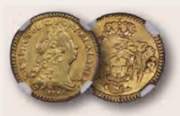
Brasilien: José I., Goldmünze zu 800 Reis 1763-R MS61 NGC Aus der Sammlung „Vila Rica“, Teil II