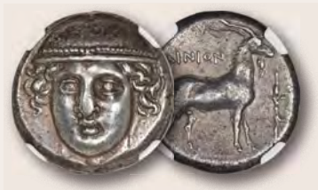
Thrakien. Aenus. Ca. 405–356 v. Chr. Silber-Tetradrachme NGC XF 5/5 – 4/5