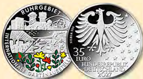
35-Euro-Sammlermünze „Internationale Gartenausstellung 2027“