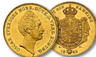
SWEDEN. 4 Ducat, 1852. Stockholm Mint. Oscar I. NGC MS-61.

LEGENDARY COLLECTIONS | LEGENDARY RESULTS | A LEGENDARY AUCTION FIRM