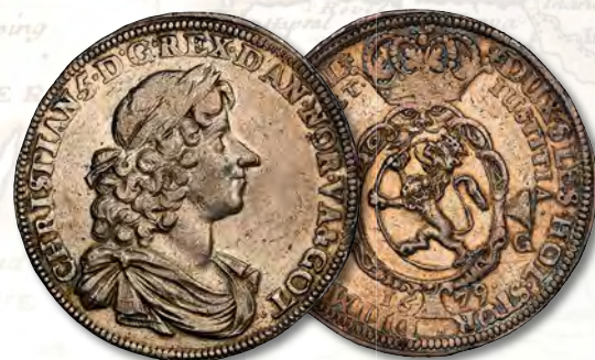
NORWAY. 2 Speciedaler, 1679. Christiania Mint. Christian V. NGC AU-55.