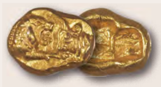
LYDISCHES KÖNIGREICH. Krösus (561–546 v. Chr.). AV-Sechststater oder Hekte NGC Choice AU★ 5/5 – 5/5