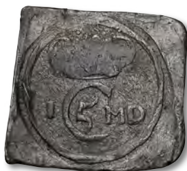
DENMARK. Uniface Mark Klippe. Lead ND (1677-78). Christianstad Mint. NGC AU-55.