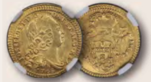
Brasilien: José I., Gold, 1600 Reis, 1768-B AU58 NGC Aus der Sammlung Vila Rica, Teil II