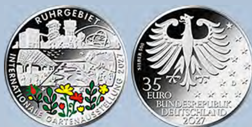
Die geplante 35-Euro-Münze für 2027 „Internationalen Gartenausstellung 2027“. Entwurf der Bildseite von Virginia Colonnella aus Offida, Italien. Entwurf der Wertseite von Michael Otto aus Hanau

Die Wertseite zeigt einen Adler, den Schriftzug „BUNDESREPUBLIK DEUTSCHLAND“, Wertziffer und Wertbezeichnung, das Prägezeichen „D“ des Bayerischen Hauptmünzamts, München, die Jahreszahl 2027