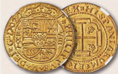
Mexiko: Philipp V., Goldmünze „Royal“ 8 Escudos, 1702, MXo-L MS67 NGC