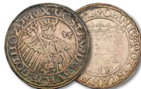
SWEDEN. Daler "Spiran", 1535. Stockholm Mint. Gustav Vasa. NGC VF Details.