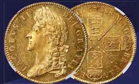
Great Britain: James II gold 5 Guineas 1688 MS64 Prooflike NGC