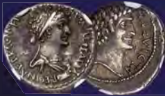
Cleopatra VII of Egypt and Marc Antony, as Rulers of the East (37-30 BC) AR denarius NGC Choice VF 4/5 - 3/5