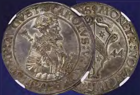
German States: Kaufbeuren Free City Taler 1544 MS65+ NGC