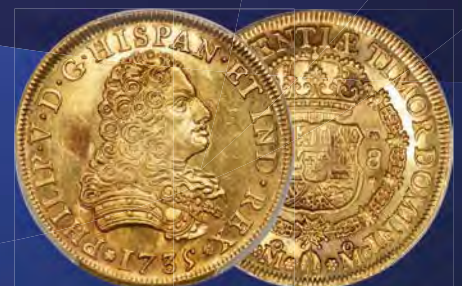
Mexico: Philip V gold 8 Escudos 1735 Mo-MF MS65 PCGS