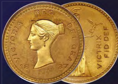
Great Britain: Victoria gold Proof Bonomi Pattern Crown 1837 PR66 PCGS