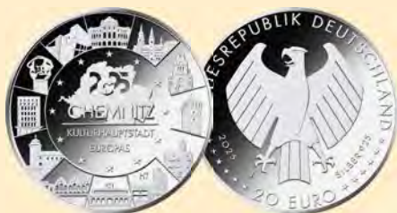
20-Euro-Silbermünze „Chemnitz – Kulturhauptstadt Europas 2025“