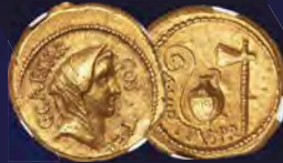
Julius Caesar, as Consul for the Third Time (46 BC), with Aulus Hirtius, as Praetor. AV aureus NGC AU 5/5 - 4/5