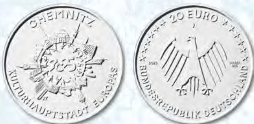
2. Preis: Patrick Niesel, Röthenbach a. d. Pegnitz

Die Bildseite präsentiert im erhabenen Zentrum der Münze die Stadt als Bühne, auf der architektonische Landmarken wie eingeschobene Kulissen eine Tiefe erzeugen. In die Szenerie hinein führt eine flache Treppe, die von zwei Personen in Hintersicht begangen wird. Sie sind plastisch modelliert, die Gebäude werden dagegen in feiner Gravur stilisiert dargestellt. Der Ausgabeanlaß bildet in serifenfreier Schrift den Außenring und korrespondiert mit dem Schriftbild der Wertseite. Die plastische Handschrift der Bildseite findet sich hier auch bei dem würdevollen Hoheitszeichen wieder.