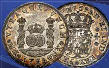
Mexico: Philip V 4 Reales 1733 MX/XM-MF MS63 Prooflike PCGS