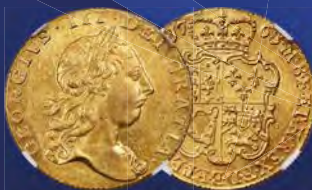
Great Britain: George III gold Guinea 1763 MS63 NGC