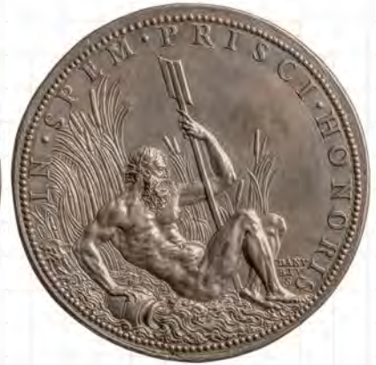
Leone Leoni (1509–1590): Kaiser Ferdinand I., um 1551, Silber (Guss), Durchmesser 76,2 mm. Kunsthistorisches Museum Wien, Münzkabinett

Eigenschaft verlieh dem Medium bis zum Ersten Weltkrieg des vergangenen Jahrhunderts herausragende Bedeutung.