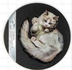
Cook Islands, 5 Dollars 2024, 999,9er Silber, 1 Unze, 38,61 mm. 999 Ex., Spezialtechnik: smartminting® (Ultra High Relief) mit partiellem Farbauftrag. Geprägt bei B. H. Mayer's Kunstprägestanstalt, München.

Av.: Porträt Charles' III. nach links von Dan Thorne (Signatur DT), darum 5 DOLLARS CHARLES III COOK ISLANDS