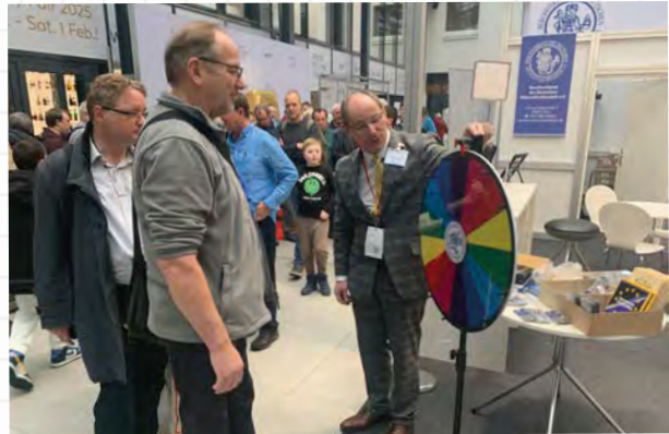
Das „Glücksrad“ des Berufsverbandes war bei der WMF wieder ein beliebter Treffpunkt.

Die World Money Fair 2024 hat für jeden Geschmack etwas geboten. Die große Messehalle im Estrel war auch in diesem Jahr den Prägestätten aus aller Welt vorbehalten. Sie sieht auf den ersten Blick aus wie ein numismatisches Disneyland und die Münzproduzenten überbieten sich mit Spezialeffekten, Sonderaktionen und neuen Münzen. Das eigentliche Messengeschäft spielt sich dagegen vor allem in den umliegenden