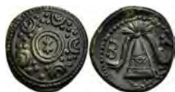
Ein besser erhaltenes Exemplar

Schauen wir dazu ein besser erhaltenes Exemplar an, Los 103 aus der Peus-Auktion 435. Die Beschreibung lautet dort: