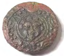
Nach einer digitalen Aufhellung ist auf dem Foto Wesentliches zu erkennen.