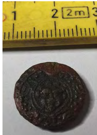
So wurde das Münzfoto digital zugesandt.

Es zeigt sich nun, dass die angestellten Vermutungen des Lesers trotz der mäßigen Erhaltung und dunklen Färbung der Münze richtig waren.