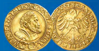
Sachsen Doppelter Goldgulden 1507 Ansatz: 60.000,-