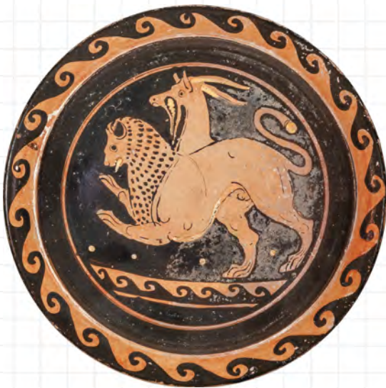
Apulisch rotfiguriger Teller mit Chimaira, Umkreis des Lampas Malers, um 330 v. Chr., Leihgabe der Eva-Maria und Berthold Schneider Stiftung

Mischwesen, das sind phantastische Wesen, die aus den Körpern von Menschen und unterschiedlichen Tieren zusammengesetzt sind. Oft werden sie als Monster bezeichnet, als Scheusale oder Ungeheuer. In den mythischen Erzählungen der Antike störten sie die Ordnung der Menschen, sorgten für Chaos und verbreiteten Angst und Schrecken. Deshalb mussten sie gebändigt werden. Diese Aufgabe übernahm gewöhnlich ein Held und die Bändigung ging mit dem Ableben des Untiers einher. Nichtsdestotrotz haben die Wesen ihre eigene Geschichte samt eigener Herkunft. Sie sind mit be-