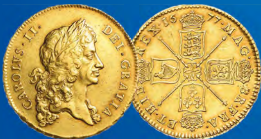
Großbritannien 5 Guineas 1677 Ansatz: 28.000,-