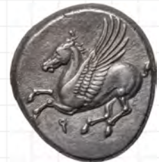
Silberstater der Polis Korinth, 345–307 v. Chr.

Fünf der Troublemaker haben sich Studenten in einer museumspraktischen Übung am Institut für Klassische Archäologie der LMU München ausgesucht, um sie selbst zu „bändigen“ und in den Mittelpunkt der diesjährigen Sonderausstellung im Pompejanum in Aschaffenburg zu stellen: die Gorgo Medusa mit dem tödlichen Blick, die feuerspeiende Chimaira, den stierköpfigen Minotaurus, die ungehobelten, auf Pferdehufen durch die Wälder galoppierenden Kentauren und die rätselstellende Sphinx auf ihrem Felsen bei Theben.