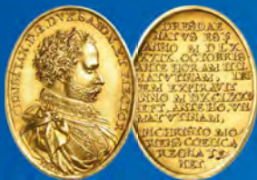
Sachsen Ovale Goldmedaille 1591 Ansatz: 20.000,-

Unter anderem mit den Serien: Russland, China, Indien. Brandenburg-Preußen, Reuss, Sachsen, Sachsen-Weimar-Eisenach.