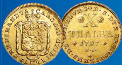
Braunschweig 10 Taler 1797 Ansatz: 3.000,-