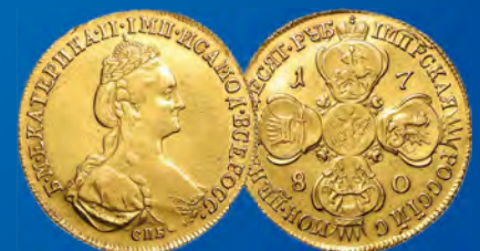
Russland 10 Rubel 1780 Ansatz: 7.500,-

Lieferrn Sie jetzt Ihre Sammlung und interessante Einzelstücke bei uns ein!