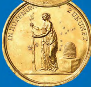
Sachsen-Weimar-Eisenach Goldmedaille zu 10 Dukaten Ansatz: 5.000,-