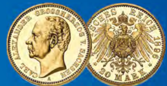
Sachsen-Weimar-Eisenach 20 Mark 1896 Ansatz: 5.000,-