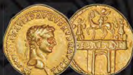
Claudius I (AD 41-54). AV aureus NGC VF 5/5 - 3/5 From The Robert C. Pickett Collection