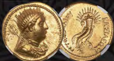
PTOLEMAIC EGYPT Ptolemy III Euergetes (246-222 BC). AV mnaieion or octodrachm NGC MS★ 5/5 - 4/5 From The Jonathan K. Kern Collection

Now Accepting Consignments to Our NYINC 2025 Auction Deadline: November 11