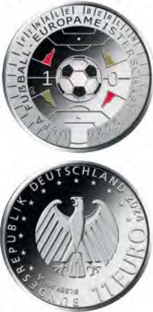
11 Euro „Fußball-Europameisterschaft 2024“

Sehr geehrte Redaktion, auch mir gefällt die 11-Euro-Münze nicht.