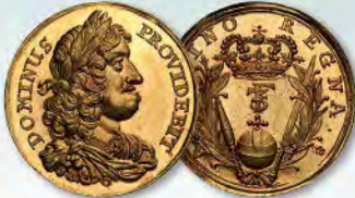
Norway. 2 Ducats, ND. Frederik III. Fr-5b. Bruun-6738. NGC MS-66★