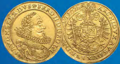
Habsburg. Ferdinand II. 1619-1637. 5 Dukaten 1628, Breslau. Herinek 98, Friedberg 153, Fr.u.S. 217. Schätzpreis: 12.000,-