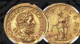
Macrinus (AD 217-218). AV Aureus NGC Choice MS★ 5/5 - 4/5, Fine Style