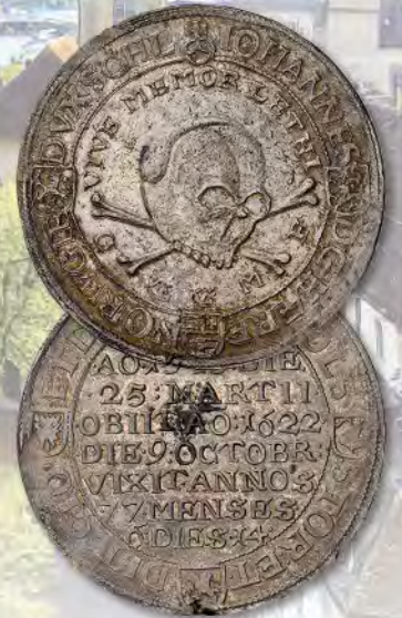
Schleswig-Holstein-Sonderburg. 2 Taler, 1622. Johann the Younger. Dav-A3715, Bruun-14664. NGC MS-61.