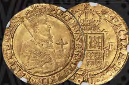
Great Britain: James I gold Unite ND (1607) MS66 NGC From The Red River Trove