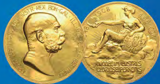
Kaiserreich Österreich. Franz Joseph I. 1848-1916. 100 Kronen 1908, Wien. Jaeger 400, Friedberg 514. Schätzpreis: 5.500,-