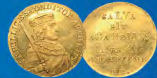
Sachsen. Friedrich August I. 1806-1827. Dukat 1809, Leipzig. 400 Jahre Universität Leipzig. Kahnt 1261, Friedberg 1440. Schätzpreis: 9.000,-