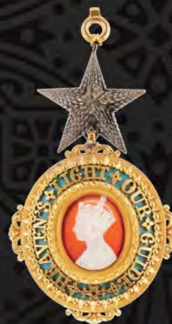
*India: Most Exalted Order of the Star of India Grand Cross Collar, Star, Sash, and Sash Badge, Instituted 1861 UNC