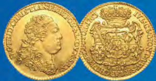
Sachsen. Friedrich Christian 1763. Dukat 1763, FWoF-Dresden. Kahnt 1001, Friedberg 2869. Schätzpreis: 20.000,-

Sonderkatalog Thematische Medaillen und Plaketten mit Sammlung Karl Goetz