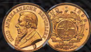
South Africa: Republic gold "g" Pond 1898 MS63 Prooflike NGC From The Gatsby Collection