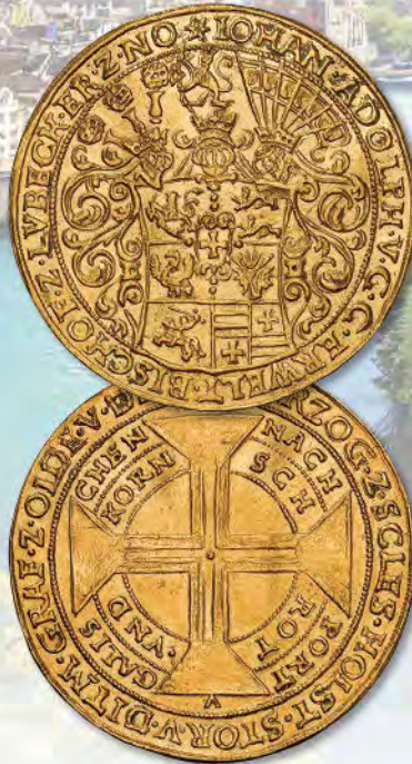
Schleswig-Holstein-Gottorp. 10 Ducats (Portugaloser), ND. Johann Adolf. Fr-1502 var, Bruun-14145. NGC Unc Details—Cleaned.