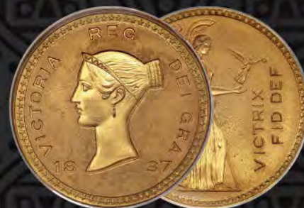
Great Britain: Victoria gold Proof Bonomi Pattern Crown 1837 PR66 PCGS