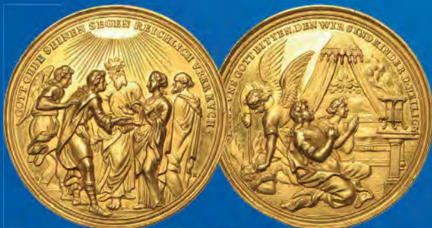
Nürnberg. Goldmedaille im 10 Dukatengewicht o.J. (um 1700) (Hautsch). Hochzeitsmedaille. Slg. Erlanger 2208. Schätzpreis: 10.000,-