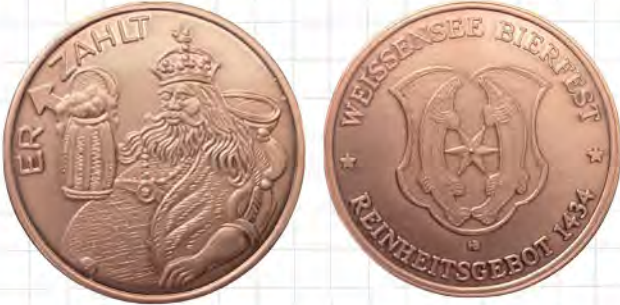
Die Weißenseer Biermedaille 2024

Alljährlich bildet das historische Stadtzentrum der Landgrafenstadt Weißensee den Mittelpunkt des obligatorischen Bierfestes. Erinnert wird mit dieser freudigen Zusammenkunft im Freien an das älteste Reinheitsgebot zur Bierherstellung. Und das in Deutschland! Zugrunde liegt diesem durch Michael Kirschschlager im Jahr 1998 wiederentdeckten Braugebot eine mittelalterliche Handschrift aus dem Jahr 1434, die sich in den Tiefen des Stadtarchives erhielt. Im Bierland Bayern stieß die Neuentdeckung allerdings auf Skepsis. Davon unbeeindruckt ging man in Weißensee mit dem Fund zügig an die Öffentlichkeit, ist dies doch eine wichtige Reklame für die thüringische Kleinstadt. Die Paragraphen 12 und 13 in dem Weißenseer Reinheitsgebot lauten: „Es soll auch niemand mehr brauen als dreimal in einem Jahr oder nach dem, wie die Räte und die Gemeinde eines jeglichen Jahres sich einig werden. Zu dem Bierbrauen soll man nicht mehr nehmen als so viel Malz, als man zu den drei Gebräuen von dreizehn Maltern an ein Viertel Gerstenmalz braucht. Es soll auch nicht in das Bier weder Harz noch keinerlei andere Ungefercke. Dazu soll man nicht anderes geben als Hopfen, Malz und Wasser.“