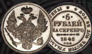
Russia: Nicholas I platinum Proof 6 Rubles 1845-CPB PR64 NGC From The Eternal Collection