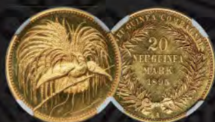
German New Guinea: German Colony Wilhelm II gold Proof 20 Mark 1895-A PR63 Ultra Cameo NGC From The Robert C. Pickett Collection