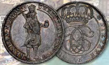
Denmark. Speciedaler, 1682. Gluckstadt Mint. Christian V. Dav-3676, Bruun-7274. NGC MS-63.

Featuring Coins from Denmark, Norway, Sweden and Schleswig-Holstein