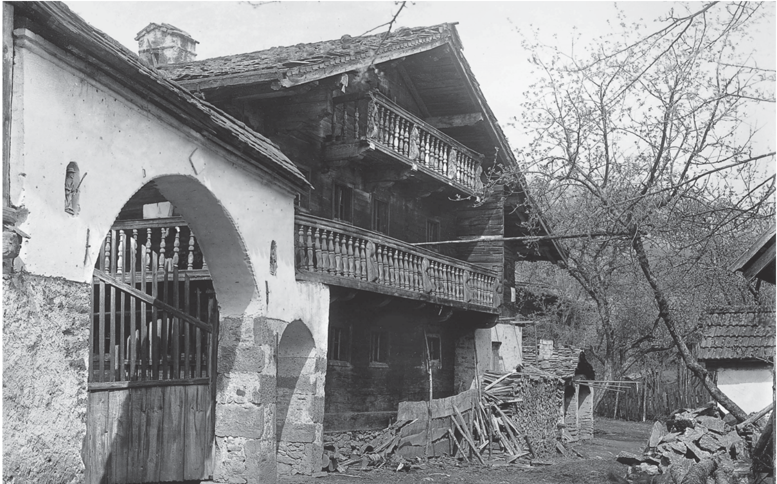
In einem Weiler bei Schaufling im Landkreis Deggendorf hat der Dorfpfarrer Max Maier diesen Bauernhof aus Holz und Stein um 1900 auf eine Glasplatte belichtet. Legschindeldeckung, Schrot und Oberbodenschrot mit gedrechselten Balustern, ein Holzblockbau vom Fuß bis unters Dach: ein klassisches Waldlerhaus. Im steinernen Hoftor spenden kleine Heiligenfiguren in engen Nischen Segen für Haus und Hof.