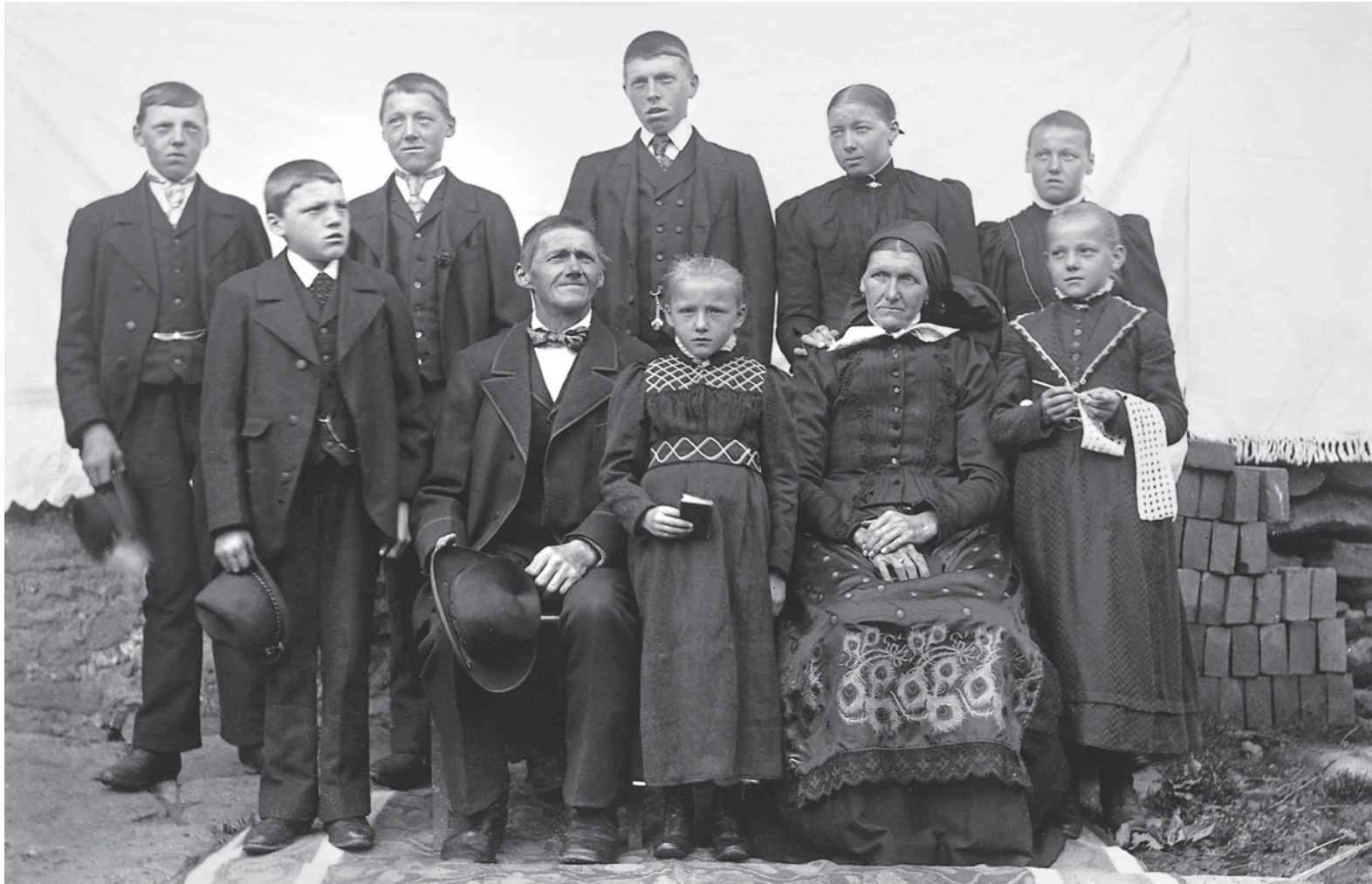
Etliche Söhne und ein paar Töchter, mittendrin wohl die ledige Schwester des Bauern. Alle blicken ganz ernst, wie es sich gehörte, nur dem Bauern selbst schaut der Schalk aus den Augen. Es war wohl ein Kirchenfest, vielleicht die Firmung des zwischen den Eltern platzierten Kindes, welches die ganze Familie in Festtagskleidern vor den Schauflinger Priester und Photographen Max Maier treten ließ.