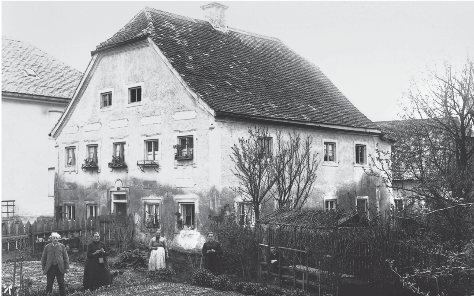
Ein Schopfwalmhaus bei Schaufling, um 1895. Bisher konnte dieses stattliche gemauerte Haus nicht identifiziert werden. Unbekannt sind auch die Personen, die in dem großen herbstlichen Garten gruppiert sind: ganz vorne links ein Mädchen mit weißer Schleife, dominierend ein älterer Mann, neben ihm wohl seine Frau, mit Strickzeug in der Hand, dann eine alte Wirtschafterin mit weißer Schürze, schließlich eine junge Frau in dunklem Kleid. In der Weinlaube, die schon blattlos ist, „fletzt“ ein junger Mann, und in der offenen Haustüre ist noch der Kopf einer siebten Person zu erkennen.